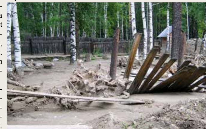
Kesällä riehunut myrsky ja sen aikaansaama tulva tekivät tuhoja Burjatiassa, Baikalin eteläpuolella sijaitsevassa Arshanin kylässä. Alueella asuu Inkerin kirkon seurakuntalaisia, jotka varjeltuivat onnettomuudessa.

Teksti ja kuva: Anitta Lepomaa - Lähetysohjekijä, Ulan-Ude