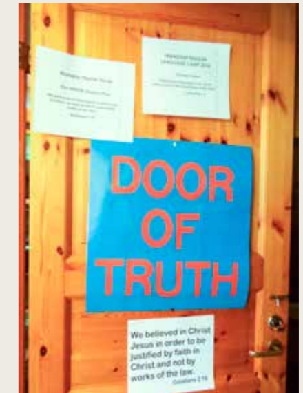
Lapset opiskelivat kesällä Keltton kirkossa englannin kieltä vaihtelevin ja mielenkiintoisin tavoin.

Teksti ja kuvat: Darja Shkurlyateva Suomennos: KP